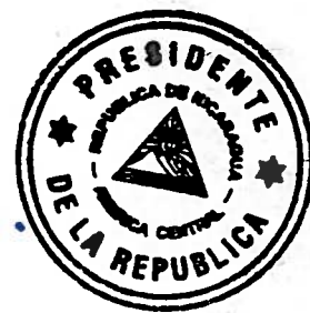
DANIEL ORTEGA SAAVEDRA Presidente de la República de Nicaragua

Dado en la ciudad de Managua, Casa de Gobierno, a los cuatro días del mes de mayo del año dos mil siete.